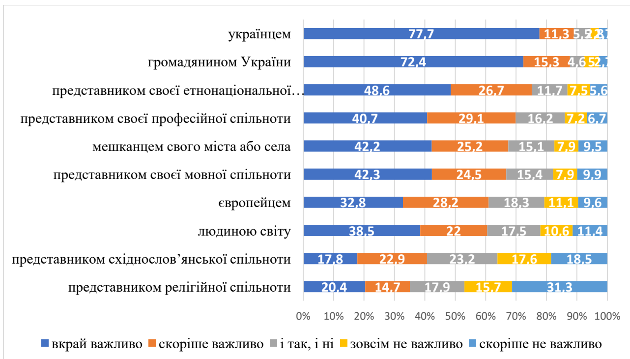
Рис. 1. Оцінка важливості належності українців до різних спільнот

відповідно (див. Рис. 1.). Найвищі показники з громадянської ідентичності серед інших варіантів ідентичності дають підстави говорити про важливість для респондентів відчуття себе громадянином України, особливо в умовах війни.